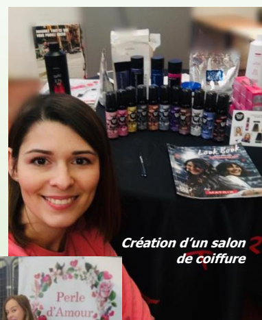
Création d'un salon de coiffure