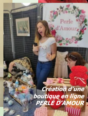
Création d'une boutique en ligne PERLE D'AMOUR