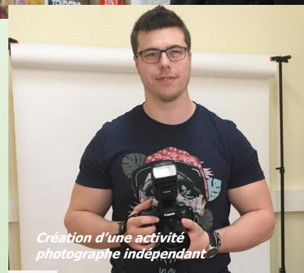
Création d'une activité photographe indépendant